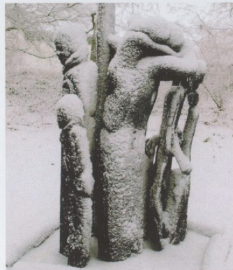
Displaced persons, Mooreiche, Denkmal in Rastede